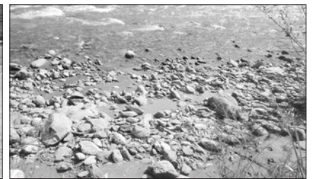
写真2 博物館側の小渋川の河原の様子