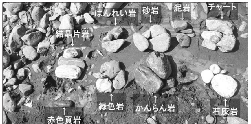
写真3 博物館前の小渋川の河原で見つけた石

博物館の前の小渋川の河原には、中央構造線の外帯側（太平洋側）の岩石のみが転がっています。河原の石をおおよその目視で分類してみました（写真3）。もしかしたら、間違いがあるかもしれませんが、ご容赦ください。河原を見渡してみて、一番多く目に付くのが、灰色の砂岩です。よく見ると砂粒が固まってできた様子が見えます。砂岩は、小渋川の最上流部にある荒川大崩壊地からたくさん流れてきているそうです。荒川大崩壊地には、黒色で表面が比較的なめらかな泥岩も分布していますが、泥岩は脆いので、流れてくる間にこなごなになってしまうことが多いそうです。少し雨が降った後、川の水が、灰色に濁り、大雨の後には黒くなるのですが、これは泥岩が細くなって川の水にたくさん含まれるためと思われます。他に、緑色の石がちらほら目に付きますが、緑色岩です。緑色と白色の斑状の模様の岩は、はんれい岩です。濃い緑色～黒色で、表面がところどころ錆びたような褐色をしているのは、かんらん岩です。白色の石は、たいていの場合、石灰岩かチャートですが、どちらの岩石かを見分けるのは難しいです。比較的やわらかくて、他の石に白い字を書きことができる場合、また、塩酸をかけてみて反応がある場合は、石灰岩です。最後に、稀に赤い石が見つかりますが、赤色チャートか赤色頁岩です。