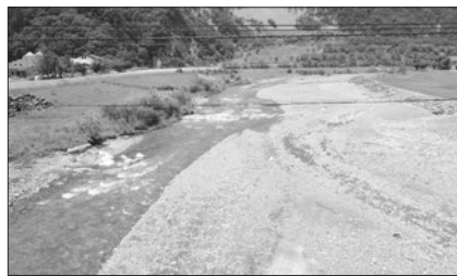
写真1 小渋橋から下流側の小渋川 (2019.06.20撮影)

このところ、博物館の見学とあわせて、河原で石を観察する来館者がちらほら見受けられます。現在、小渋橋のすぐ下流では、小渋川の流は、左岸側（博物館寄り）に流れているため、水がついていないスペースは限られていますが（写真1）、石の観察ができる状態です（写真2）。石の観察に夢中になって、川の中まで入って流されてしまうことのないよう注意しつつ、楽しんでいただければと思います。