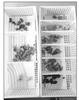
貼り付け型岩石標本用の岩石の破片