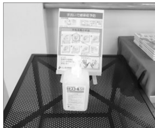
写真1 受付横に手指消毒液を置いてあります!

博物館では、2月下旬より、新型コロナウイルス感染拡大防止のため、2階の国土交通省の展示スペース閉鎖、手指消毒液の設置(写真1)などの対策が取られています。3月末の時点では、博物館自体を閉館する予定はありませんが、今後どうなるかは、国内外の状況を見ての判断となるかと思えます。どうぞご了承ください。今年度のイベントにつきましては、大鹿村ジオツアーとエコパークスキルアップ講座を実施する計画にはなっていますが、とりあえず、春の開催は見送る方向で検討中です。楽しみにしていただいたところ申し訳ありません。