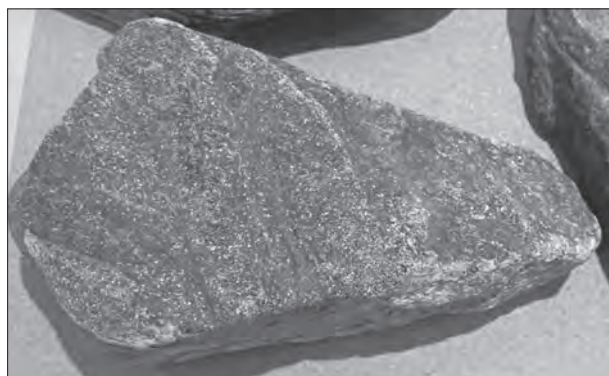
写真2 泥質変成岩 片麻岩と表記されることもある