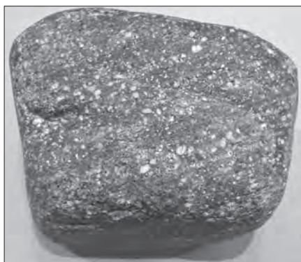
写真1 斑状マイロナイト 鹿塩マイロナイトの名でも知られる

青崩峠トンネルの調査坑では、斑状マイロナイト、泥質変成岩、珪質変成岩などが見られたそうです(高橋・桜井(2017)参照)。斑状マイロナイトというのは、おそらく、もとは花崗岩質の岩石が、断層運動によって、地下深くで引き延ばされるように変形してできた岩石で、長石の白い斑点が見られるのが特徴です。泥質変成岩、珪質変成岩は、それぞれ、もとは泥岩、チャートだった岩石が、マグマの熱によって、変成してできた岩石です。泥質変成岩は、きらきらした黒雲母の結晶が見られるのが特徴で、珪質変成岩は、半透明のなめらかな肌触りの岩石です。これらの変成岩も、中央構造線の近傍に位置していることから、断層運動によって、引き延ばされるように変形してしまっている可能性があります。見せていただいた貫通石のうち、1つは斑状マイロナイト、もう1つは泥質変成岩のようで、同じ種類の博物館の岩石標本(写真1, 2)を見ていただきました。