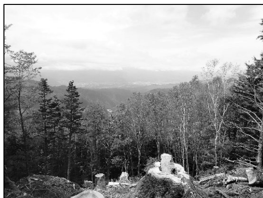
写真2 ビューポイントからは小沢峡方面の展望！