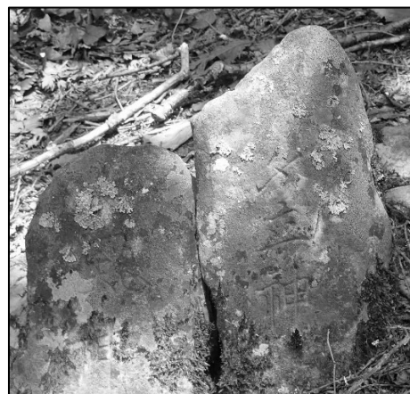
写真1 右にはタ立神、左には風神と書かれていた。