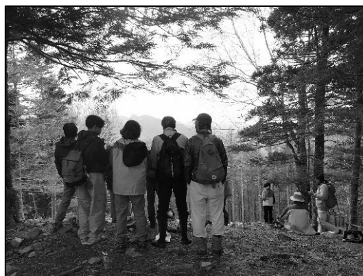
写真3 山頂からは荒川岳方面の展望！