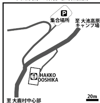
大池高原の集合場所位置図

※観察会終了後、希望者は、大池高原にあるカフェ・HAKKO OOSHICA さんにて休憩できます。飲み物の注文もできます。パフェ注文希望者は、8月14日（水）までに大鹿村中央構造線博物館までに連絡下さい。