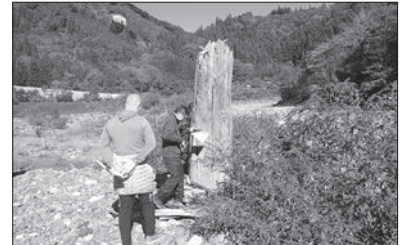
写真1 遠山川の埋没林(木沢地区)

大鹿村でも、昭和36年の集中豪雨で大西山が崩れたときに、小渋川に河道閉塞が発生しましたが、20分後には決壊したそうです(*3)。また、入谷地区では、長年、大がかりな地すべり対策工事が行われてきましたが、これは、万が一、塩川に河道閉塞箇所ができた後、決壊すると、下流の大鹿村役場や周辺人家に甚大な被害が及ぶ危険があるため、河道閉塞を起こさないことを目的とした工事でした(*4)。(宮崎)