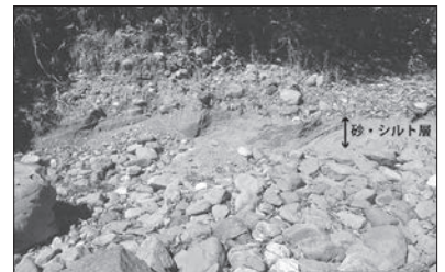
写真2 湖に堆積したと思われる 砂・シルト層