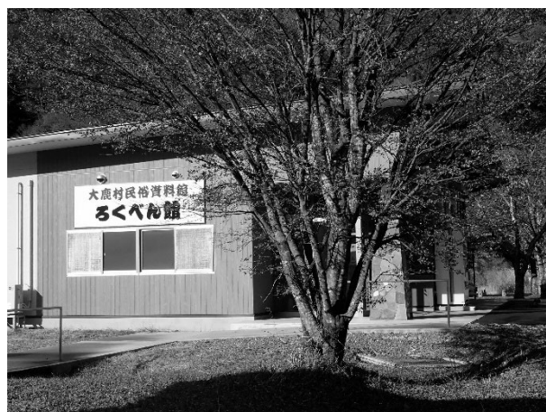
写真3 ろくべん館の壁面看板