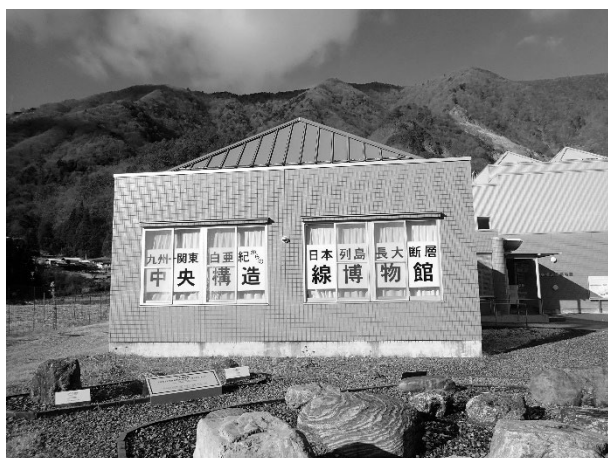
写真2 博物館窓面看板

また、博物館の窓面に貼り付けてあった建物名称看板の貼り替えも行いました。今までは、博物館スタッフが紙に印刷して貼り付けただけの簡素なもので、色褪せが進んで見えにくい状態になっていたため、今回は看板業者をお願いして、しっかりとしたシートを貼り付けていただきました。隣のろくべん館の壁面看板取り付けも併せてやっていただきました。これで初めて来られた方が道路から見て、この2つの建物が一体何なのか分かりやすくなったかなと思います。