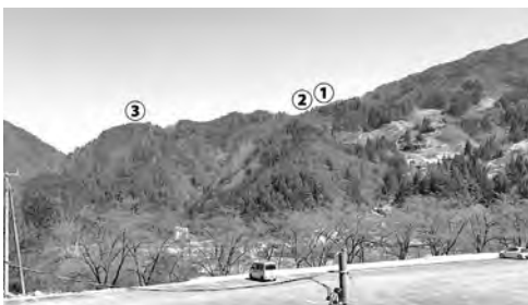
写真1 大西公園から堀田城方面遠望