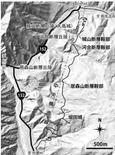
図1 大島城と堀田城は鹿塩と大河原を結ぶ秋葉街道沿いに立地

なお、①の南方にある中尾茶屋堂(図2)は、陣鐘堂とも呼ばれ、この老松に陣鐘をつるしておき、有事の際に知らせたという逸話が残っています。現在の堀田城内は草木が茂って展望はイマイチですが、茶屋堂からは、地蔵峠方面の青木川の谷がよく見えます。(宮崎)